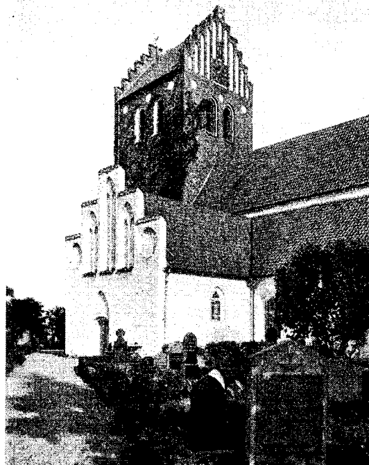
Utsikt över Båstad mot väster samt kyrkan.

sid. 120). Det skrevs 1450 Bostædhæ och 1472 Bodstedhæ. — Litt.: E. Thysell, "Ett och annat om det gamla B." (1913); H. Hammarlund, "B. och Bjärebygden" (1922). P.;E.W.;Sl.